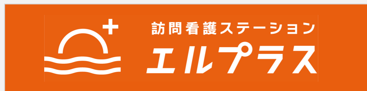
オレンジベタ：横組み