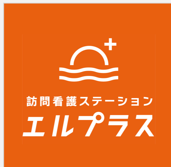
オレンジベタ：縦組み